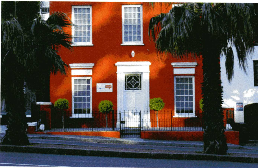
Stilvoll und einladend: Im südafrikanischen Kapstadt, Wale Street 70, befindet sich die Sprachschule des deutschen Auswanderers Kraus

Firmengründung in Südafrika – wie erwartet eine echte Herausforderung. „Gerade als Nicht-Südafrikaner musste ich einen Haufen Formblätter ausfüllen und Urkunden beibringen, von denen ich noch nicht mal wusste, was genau gefordert wurde.“ Schmunzelnd fügt er hinzu: „Die Registrierung des Firmennamens zum Beispiel musste zunächst durch einen Freund erfolgen und konnte erst später auf mich übertragen werden.“ Auch die Suche nach Unterrichtsräumen gestaltete sich schwierig, wollte man dem Anspruch einer „premium language school“ doch rundum gerecht werden. Mit dem Gebäude in der Wale Street wurde dann zwar das geeignete Domizil gefunden, doch der Umbau im Innenbereich und eine neue Einrichtung schlugen mit einem fast fünfstelligen Betrag zu Buche – eine Menge Geld in der Gründungsphase. Miete und Personal sind dann auch folgerichtig die beiden größten Fixkostenblöcke. Neben Lebensgefährtin Diana als „Operations Manager“ hat Director Johannes Kraus noch zwei festgestellte Lehrer im Kernteam. Beide sind ausgebildete Lehrkräfte aus Südafrika und bringen als native speakers reichlich Erfahrung im Umgang mit Sprachstudenten von anderen Schulen mit. „Erstklassiger Englischunterricht ist die Basis unseres Konzepts, da lässt sich nicht sparen. Die Lohnkosten sind natürlich geringer